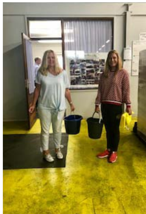
AkzoNobel gebruikte hun teamuitje om Voedselbank Arnhem een handje te helpen.

Wij begrijpen dat groepen niet zomaar ingeschoven kunnen worden in reguliere processen. Maar wellicht moet er nog geschilderd of schoongemaakt worden? Kerstpakketten gesorteerd? Of is er mankracht nodig voor supermarktacties en kun je dat combineren met een rondleiding bij de voedselbank? Als het niet op de gewenste dag is, kun je gezamenlijk misschien tot een nieuwe datum komen? De opbrengst van een teamuitje kan zo veel meer zijn!